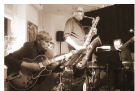
Jazzmeile presents: "Cookbook"