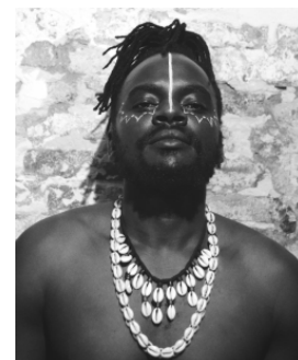
"Afro Fusion Xperience" Fr. 19.05.2017, 20:00 Uhr