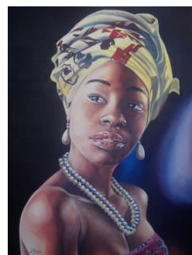
"Birth of Colors" 14.05. - 09.06.2017