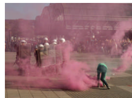
"Gefahrenggebiete, Gipfel & andere Hamburgensen" Do., 01.06.2017, 19:30 Uhr

Parallel zum Bühnenprogramm mit ca. 20 (!) Live Musik- und Tanzgruppen , bei der die Vielfalt des Kulturladens widerspiegelt wird, gibt es einen Eltern/Kinder-Flohmarkt auf dem Campusgelände der HAW, sowie einen Anwohnerflohmarkt, Spielaktionen für Kinder mit den Falkenflitzern und Hipo den Clown; es gibt Irish Set Dance, Tahitianische Tänze, Salsa, Percussion und Swingtanz als Workshops zum Mitmachen, Tombola und kulinarische Leckereien aus Afrika, Polen, Argentinien, Iran, Indien und Japan, sowie Infostände von den unterschiedlichen Gruppen und Vereinen, die im Kulturladen aktiv sind - und viele weitere Überraschungen... JEDER IST HERZLICH WILLKOMMEN!