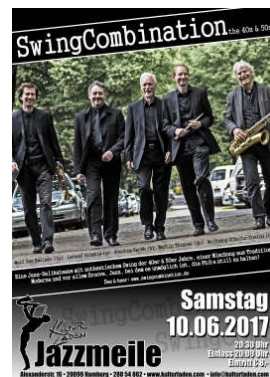
Jazzmeile presents: "SwingCombination" Sa., 10.06.2017, 20:30 Uhr

Der Gärtner steht in seinem Obstgärtchen und möchte Kirschen ernten. Dabei braucht er die Hilfe und die Ideen der Kinder, denn zusammen geht immer alles besser. Die Zuschauer stehen dem Spieler beratend zur Seite, sind aufgefordert mit zu überlegen, welche Sache er als nächstes ausprobieren soll. Aber dann ist da noch der Rabe, der ebenfalls versucht, an die Früchte heran zu kommen. Wie werden sie es schaffen, vor ihm am Ziel zu sein? Bei schönem Wetter findet es im Garten des Kulturladens (hinterm Haus) statt!