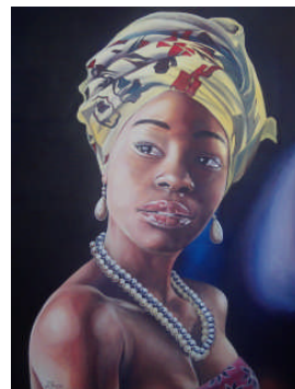
"Birth of Colors" 14.05. - 07.07.2017