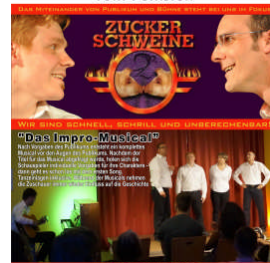
"Zuckerschweine - Das Impro-Musical" Fr., 09.06.2017, 20:00 Uhr

Hamburger Improvisationstheater vom Feinsten