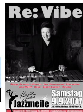
Jazzmeile presents: "Re: Vibe" Sa., 09.09.2017, 20:30 Uhr