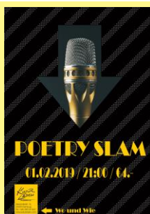
Poetry Slam 01.02.2019