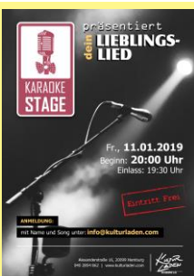
Karaoke Stage 11.01.2019