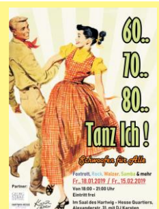
60,70,80 Tanz Ich 18.01.2019