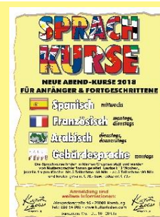
Sprachkurse siehe Rückseite