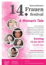
A Woman's Tale