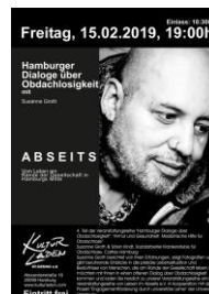
Leben im Abseits