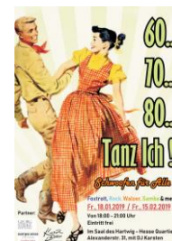
60,70,80 Tanz Ich